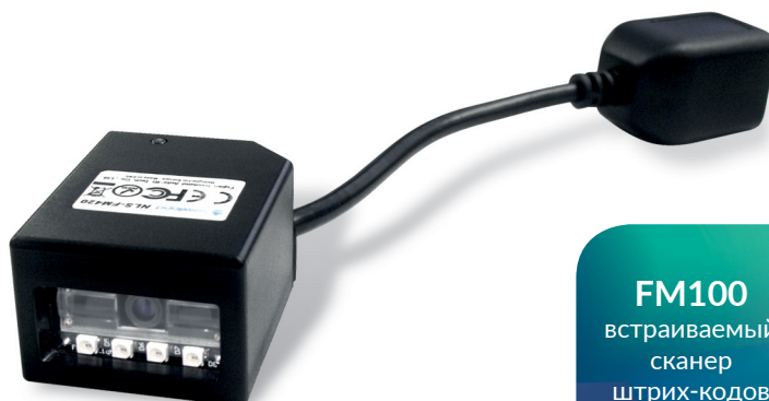
FM100 встраиваемый сканер штрих-кодов