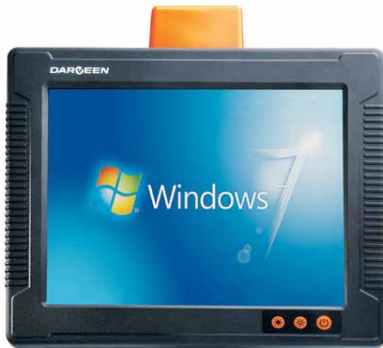
Рис. 1. Защищенный панельный компьютер Darveen VT-858

в транспортные средства представлены в виде панелей и встраиваемых боксов, панельные автомобильные компьютеры выполнены в литом корпусе, снабжены дисплеем и клавиатурой. А встраиваемые автомобильные боксы выпускаются в компактных корпусах, оснащены всеми необходимыми видами связи и предполагают использование систем диспетчерского удаленного управления.