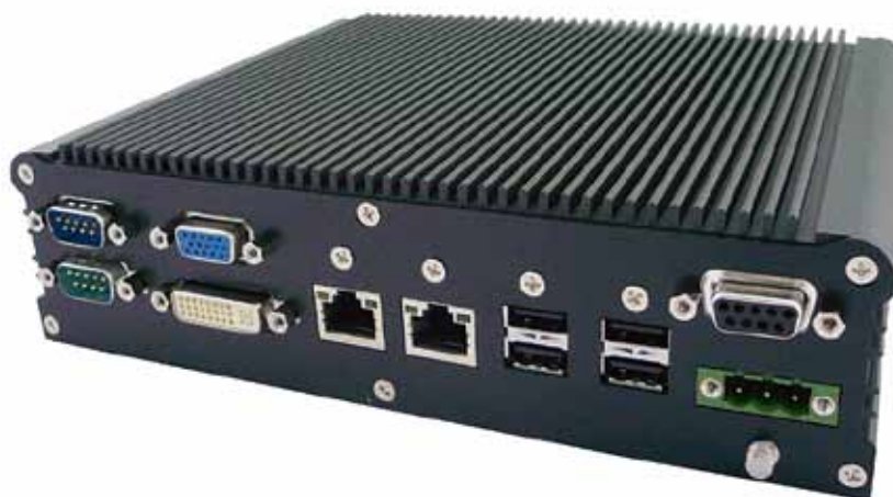
Рис. 2. Встраиваемый компьютер Darveen MC-6000

Панельные компьютеры со степенью защиты IP65 выпускаются как в облегченных алюминиевых корпусах, так и в корпусах компакт-