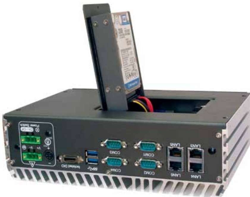
Рис. 3. ECS-7000, встраиваемый компактный безвентиляторный компьютер для транспорта

Применяется оборудование Darveep и на тяжелых транспортных средствах. Безопасность – один из наиболее важных вопросов современной горнодобывающей промышленности. Поэтому так важны решения на базе компьютеров Darveep, специально разработанных для работы на тяжелых ТС, которые стабильно функционируют в чрезвычайно суровых условиях и обеспечивают безопасность рабочих бригад (рис. 3). Оснащенные системами GPS и ГИС (Географической информационной системы) ПК помогают машине избегать столкновений во время транспорти-